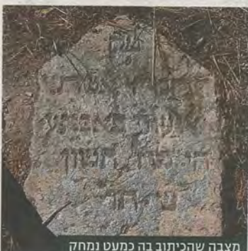
מצבה שהכיתוב בה כמעט נמחק