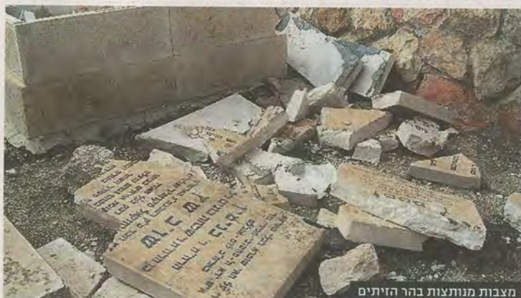
מצבות מנוצצות בהר הזיתים